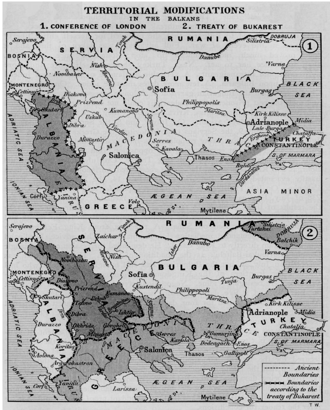
1914 Carnegie Vakfı Raporu'na Göre Balkan Savaşları Sonunda Balkan Coğrafyası

daha cazip gösteriyordu. Buna göre nüfus çoğunluğu Sırp'lardan oluşan ve içerisinde Bosna Hersek, Hırvatistan'ın bir kısmı, Slovenya ve Dalmatya'nın bulunduğu Büyük Sırbistan Balkan Savaşlarının ikinci evresine kadar birliğin bir numaralı amacını teşkil etmiştir. İkinci planda Bulgarlar da bulunsalar Balkan Savaşları sırasında ortaya çıkan kanlı Sırp-Bulgar çekişmesi içerisinde Bulgarların bulunduğu Slav birliği projesini erken bitirdi. Üçüncü sırada ise Yugoslavizm ve Yugoslavya vardı. Ancak bu proje hepsinde zordu, zira ortada gerçek manada bir ulus yoktu 10 .