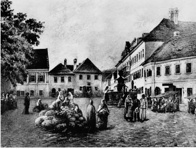
18. Yüzyılda Sremski Karlovci

Sremski Karlovci 'de başlayan bağımsızlık eğilimi kısa zamanda yayıldı ve 19. yüzyılın başında artık Balkanlar'da Osmanlı birliği sarsılmıştı. Özerk Sırbistan diğer Balkan halklarını da etkiledi şüphesiz ki. Özellikle Yunanistan biraz da Batı'nın desteği ile birlikte Sırlardan çok daha derin bir değişime doğru hareketlendi.